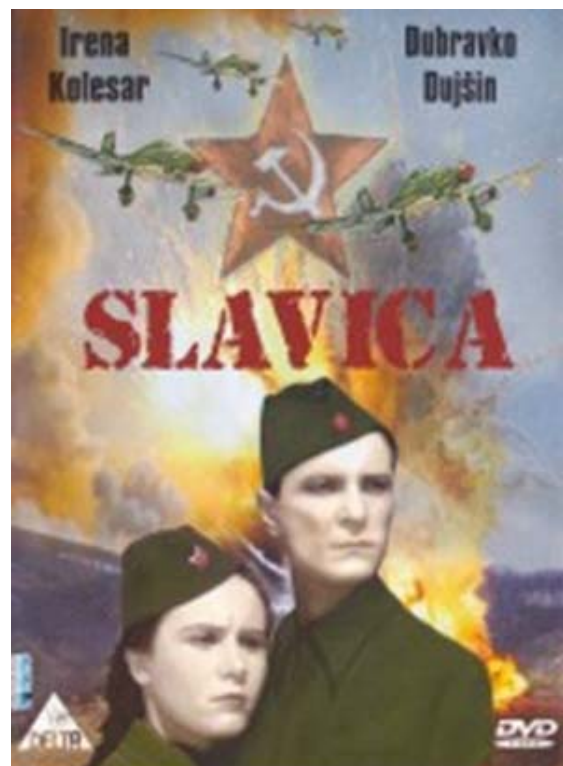
Југословенски ратни филм „Славица“

А онда долази слобода и ера савремених филмова, обојених социјалистичком идеологијом, као што су: „Пастир Костја“, „Воз иде на исток“ или бајке као што је „Камени цвет“ и др. У то време се појављује и први југословенски ратни филм „Славица“ „обојен“ истом фарбом.