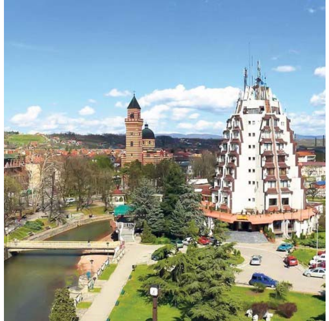
Паркови у Параћину

Горњи парк, тј. део од моста до излаза код цркве коришћен је за шетњу и предах у току сваког дана. Доњи парк, заправо део од павиљона, преко мостића, код старе чесме, до излаза за Ада кале, коришћен је за одмор и освежење поред водоскока и на мостићима код воденице, испод којих је протикао већи део тока реке Црнице. Овај део парка нарочито су посећивали заљубљени. Недељом је парк био изузетно посећен и интересантан.