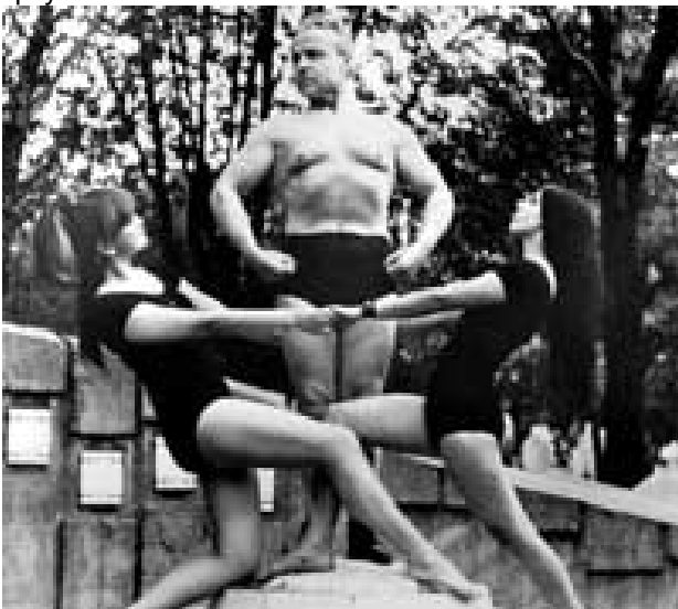
Невиност без заштите – први српски звучни филм, снимљен 1941, приказан 1942. године

За време окупације приказиван је и први српски филм „Невиност без заштите“, који је снимио циркуски атлета Алексић.