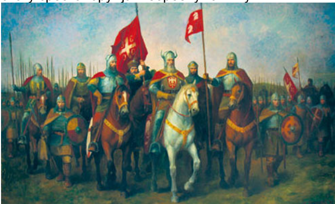
Српска војска са кнезом Лазаром на челу

Управо са Витомиром, војвода Цреп је разбио Турке на Дубравници 1380. или 1381. године. Била је то значајна победа Срба над званичним турским војним формацијама, које су имале циљ да у мањим окршајима и сукобима са Србима испробају снагу србског оружја и борбену тактику.