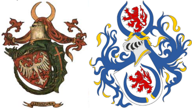
Грб династије Лазаревића и Бранковића

наследника. Тако да је кућа Орловића сада имала само једно женско дете.