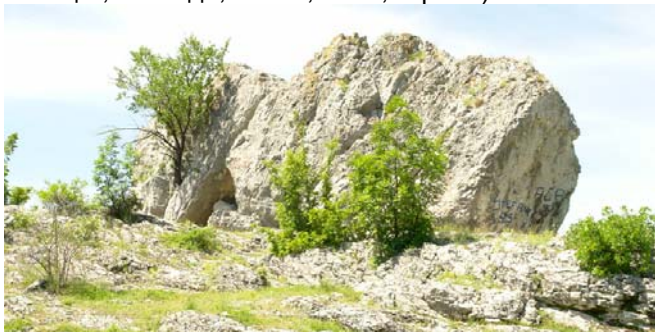
Петрушка област у селу Забрега