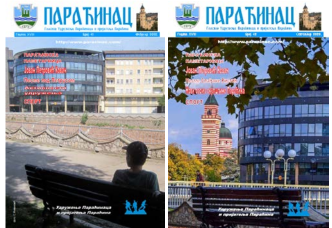
Гласило Параћинац у 2020. години

2020. године. Од тада није било редовних окупљања, већ су се активности Удружења свела на личну комуникацију и дружење преко друштвених мрежа и нашег портала на фејсбук профилу Удружења.